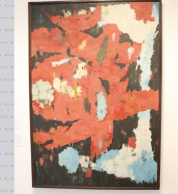
斎藤義重 作品A 1958年

ることができました。海外渡航が簡単ではない時代にあつても、パリなど海外で意欲的に学んだ画家もいました。 展示しやすい小さな作品や、公募展に出展するための大きな作品など、当時の画家たちが積極的に描いた絵画が展示されました。中には、前田青邨によるヘンキンの絵と、その絵が表紙を飾った当時の週刊誌とが、並べて展示される例もありました。 このように作品の主題、絵具の質感、雑誌などの資料、全てが1950年代当時の空気を感じさせる素晴らしい展覧会でした。