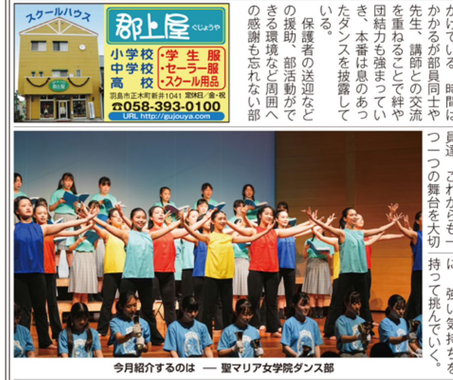
今月紹介するのは — 聖マリア女学院ダンス部