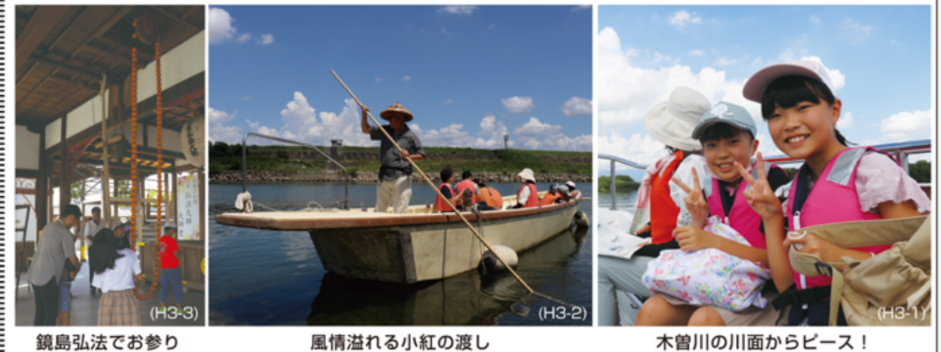
鏡島弘法でお参り 風情溢れる小紅の渡し 木曾川の川面からピース！

羽島市歴史民俗資料館 夏休み教室 羽島市歴史民俗資料館内では、ルート沿いの料館が市内の小学生を対象に毎年開催している夏休み歴史教室。今年は県内にわずかに2箇所しか残っていない渡し船を体験する企画が8月1日(火)に実施され、木曾川の西中野渡船と長良川の小紅の渡しをバスで巡った。 最初の目的地「西中野渡船」は両県の県道の一部となっており、すぐ北に2025年開通予定の新濃尾大橋(仮称)が建設中のため、存廃が危ぶまれている。羽島市側の無人乗船場にある旗を掲げると、船頭小屋のある一宮市側から迎えの船がやって来る仕組みとなっており、約7分の船旅に初めて乗る子どもたちは大はしゃぎだった。次の目的地「小紅の渡し」までのバス