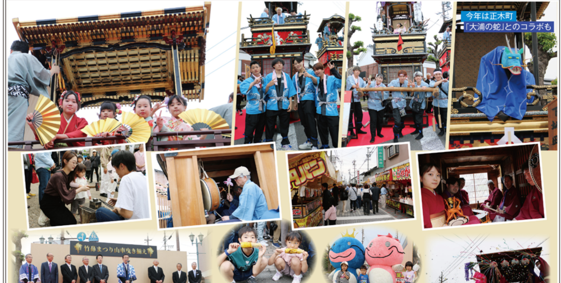
今年も正木町「大浦の蛇」とのコラボも